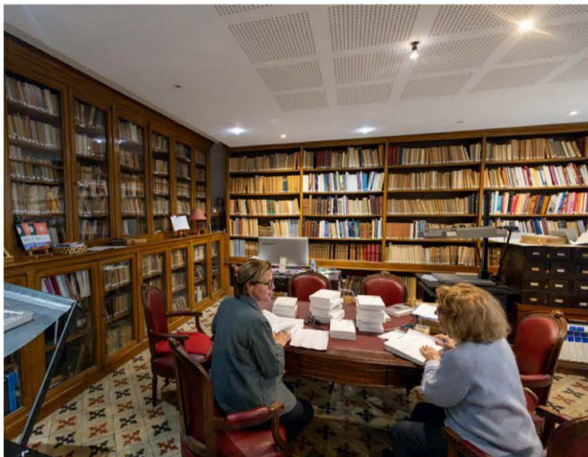
La bibliothèque de l'Académie recèle de nombreux trésors sur l'histoire de Marseille et de la Provence.