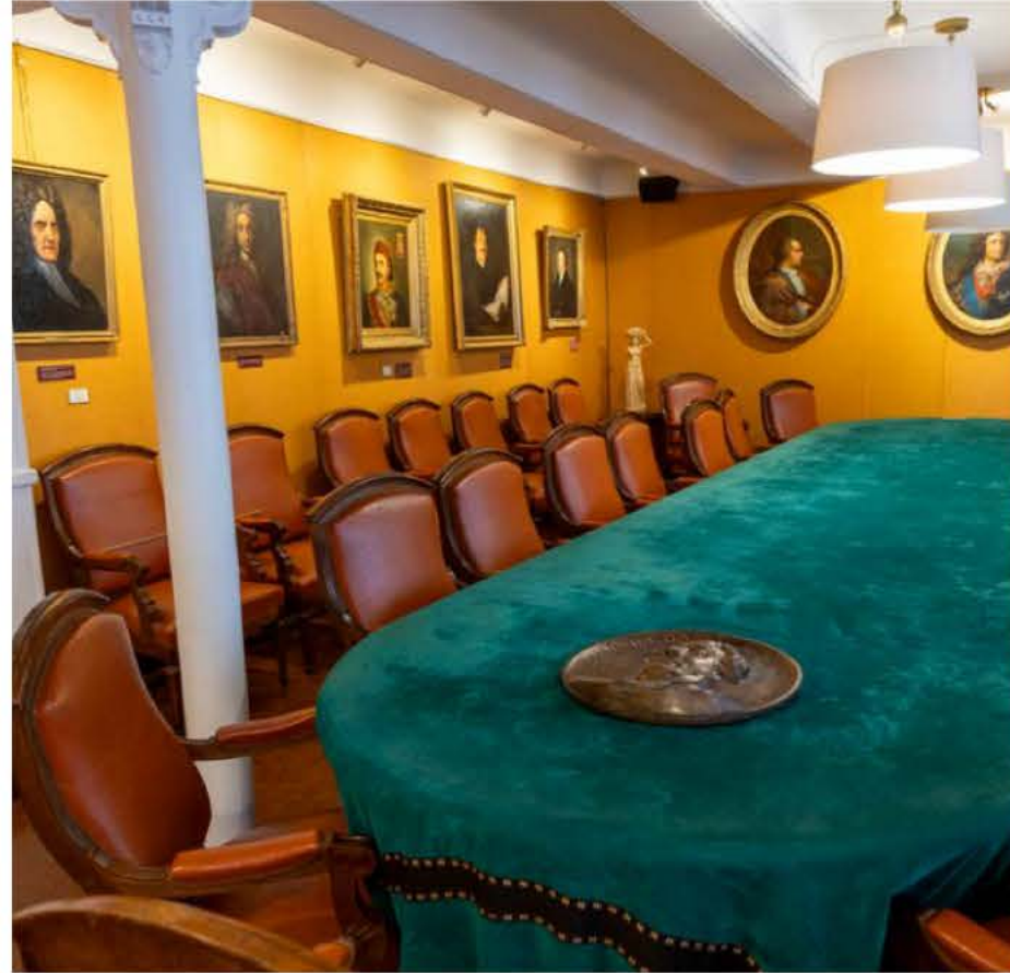
Pour les Journées du patrimoine, en septembre, il sera possible de découvrir le siège de l'Académie de Marseille, rue Thiers.

Les 19 et 20 septembre , à l'occasion des Journées européennes du patrimoine, le public pourra visiter le siège historique de l'Académie, rue