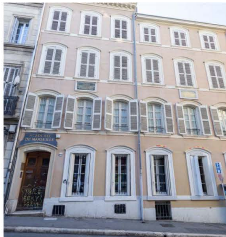
La belle-sœur d'Adolphe Thiers a fait don de deux immeubles de la rue des Petits-Pères, actuelle rue Thiers, pour qu'ils deviennent le siège de l'Académie.