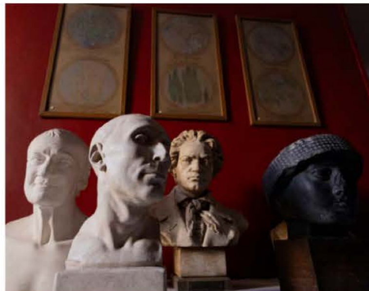
Parmi les collections de l'Académie, de nombreuses sculptures.