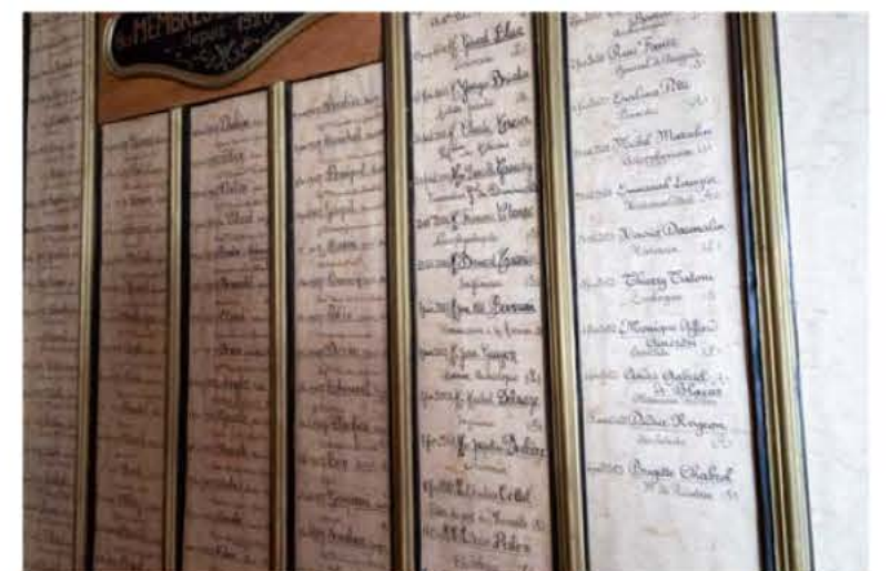
On les appelle les immortels. Les 590 noms des académiciens qui se sont succédé pendant trois siècles à Marseille sont écrits à jamais à l'encre noire au premier étage de la rue Thiers.