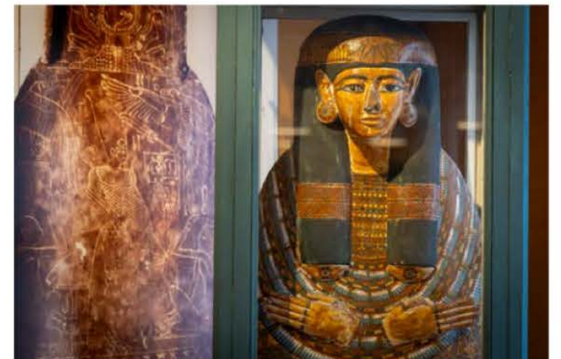
L'archéologie est présente sous la forme de quelques pièces remarquables comme ce couvercle de protection de momie du XI e -X e siècles avant notre ère.